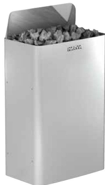
THE WALL E

Der beleuchtete Bedienschalter zeichnet sich am Oberteil des Ofens ab, wo er sich auch im Dunkeln leicht bedienen lässt.